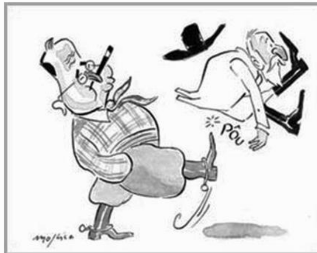
Vargas afastando um coronel.