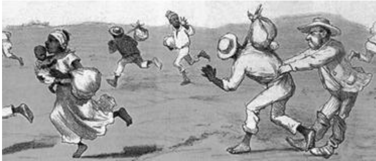
Angelo Agostini - 1886.

1. A CHARGE abaixo foi publicada no Brasil em 1886. Feita por Angelo Agostini, a imagem mostra uma fuga de escravos .